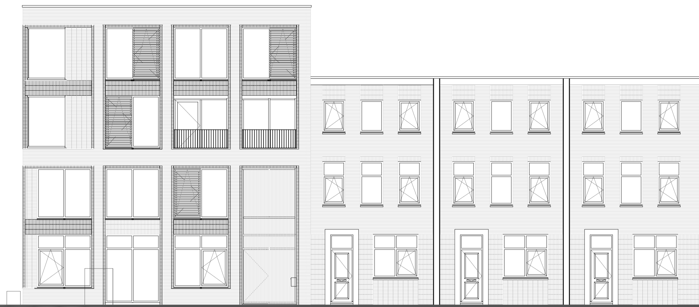
voorgevel - Drienerweg