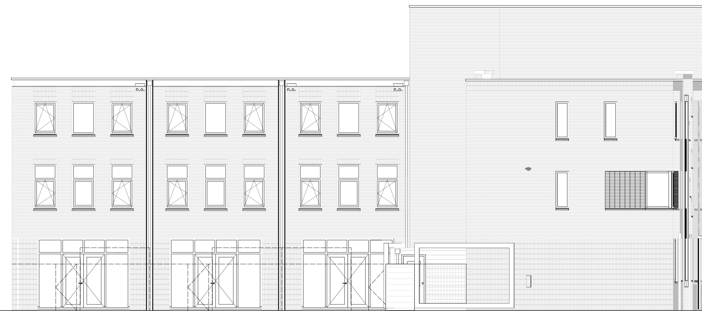
31 29 27 achtergevel - Drienerweg