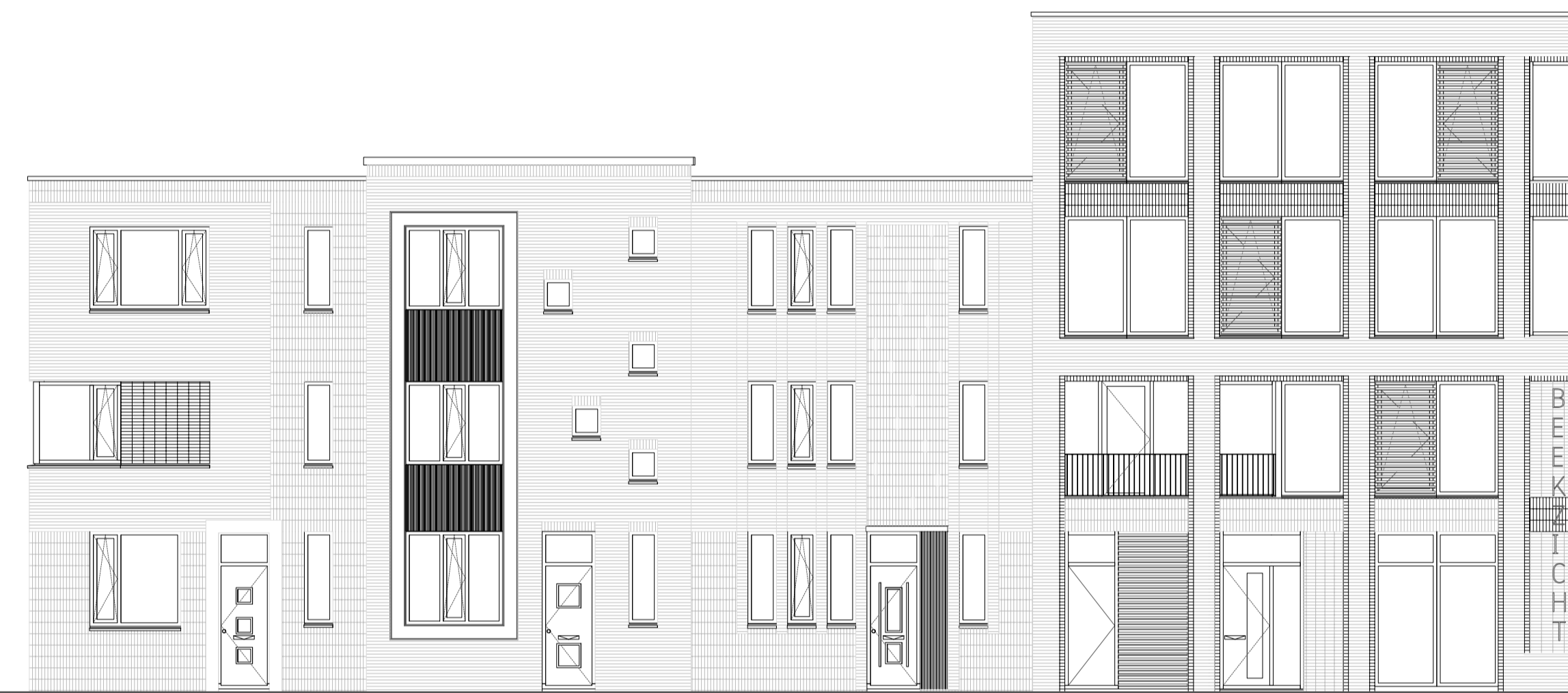
14 12 10 8 Voorgevel - Walhofstraat