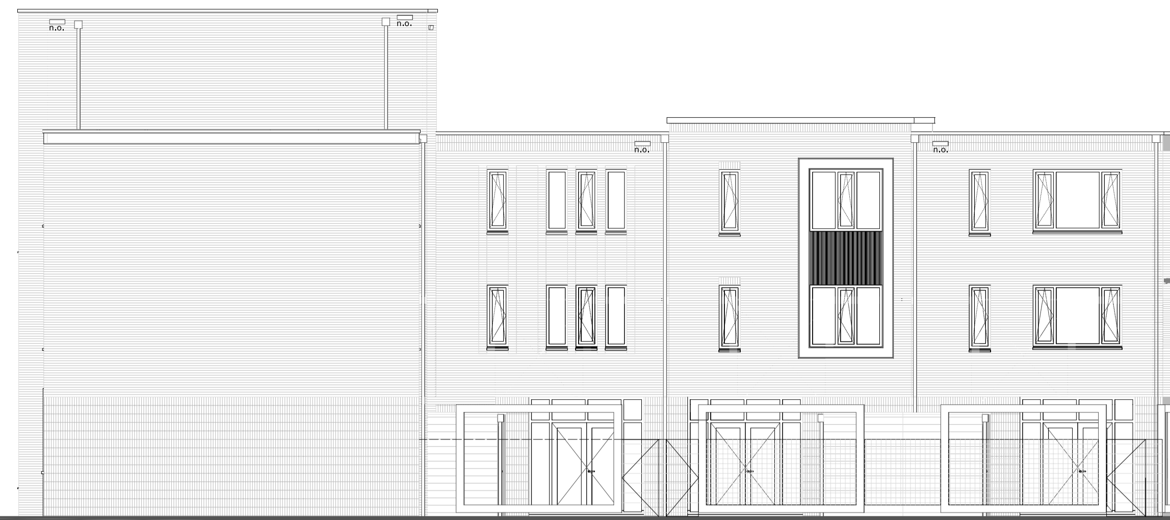
rechtter zijgevel - Drienerweg