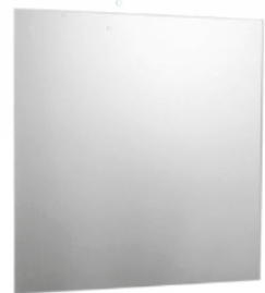
Vlakke wandspiegel 57x40cm